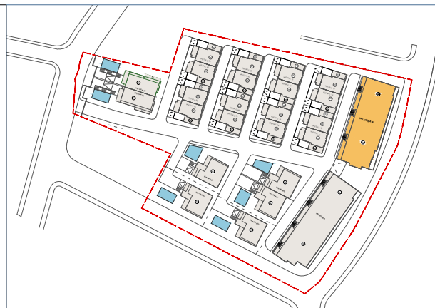
PLANI I VENDOSJES SE APARTAMENTEVE SH 1: 750