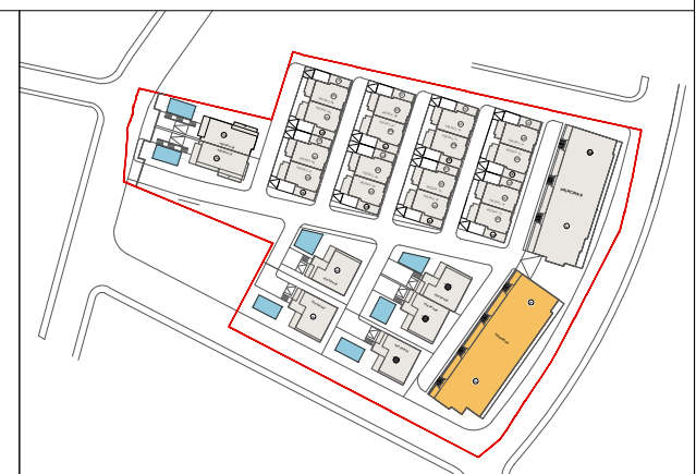
PLANI I VENDOSJES SE PARKIMEVE SH 1: 750