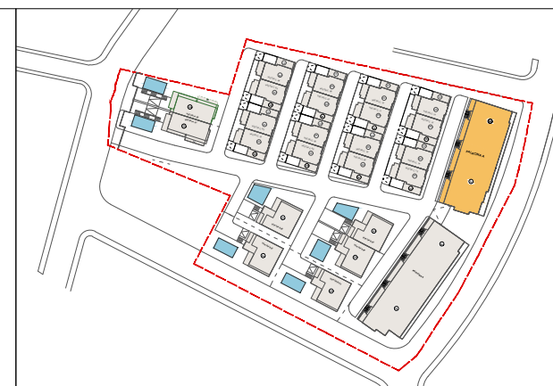
PLANI I VENDOSJES SE PARKIMEVE SH 1: 750